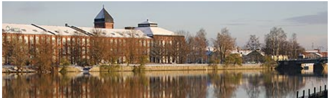
Porin yliopistokeskus Kokemäenjoen rannalla