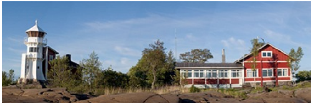
Kallon majakka ja Suomen vanhimman pursiseuran BSF:n paviljonki Mäntyluoto, Pori