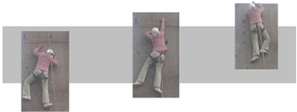
Citius, Altius, Fortius - Aton Asiakaspäivä 29.9.