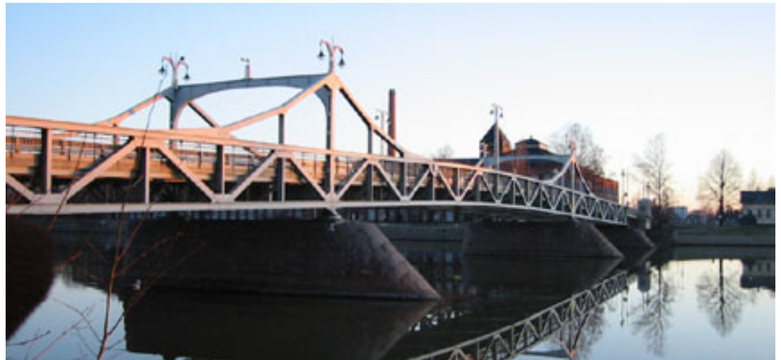
Porinsilta, takana vanha puuvillatehdas