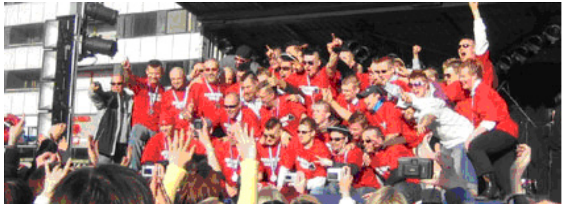
Porin Ässät - jääkiekon Veikkausliigan hopeajoukkue 2006

Using Modultek's web-centric solutions, our customers can enjoy the full benefits of these technologies and revolutionize their business. Modultek is devoted to providing solutions that denote real business benefits. Internet and mobile communication-based solutions enable our customers to capitalize on time, save costs and