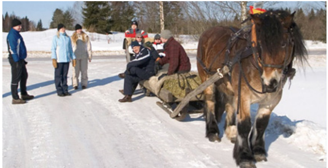
Tuumaustauko lamuskoja vetävällä pollella Modultekin virkistyspäivässä.